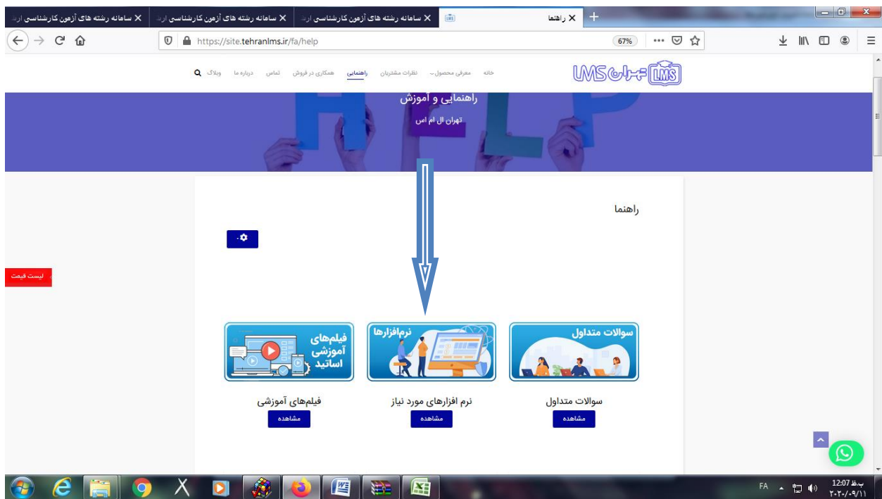
7- برنامه ادوبی کانکت را نصب نمایید.